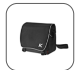
Sacoche « K »