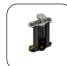
Tiroir batterie AA