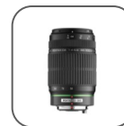
Objectif DA 55-300mm