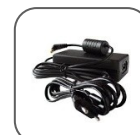
Kit adaptateur AC